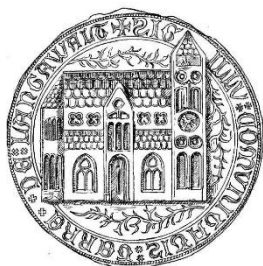
Fig. 1 Het zegel van het landgoed Langewold waarop de oude kerk van Sebaldeburen is te zien zoals deze er in de 15 e eeuw vermoedelijk heeft uit gezien.

Het waren de missionarissen Willibrord en Bonifatius die in de 8 e eeuw na Chr. het christendom in onze regio verspreidden. Korte tijd daarna werden veel kerkelijke gemeenten gesticht en kerken gebouwd waaronder de eerste kerk van Sebaldeburen, gewijd aan de heilige Sebalduus. Op het zegel van het plattelandsdistrict Langewold (een van de Groninger Ommelanden) is een afbeelding te zien van de oude kerk van Sebaldeburen zoals deze er vermoedelijk in de 15 e eeuw uitzag nl. een monumentale kruisbasiliek met een halfronde uitbouw aan de zijde van het koor (absis).